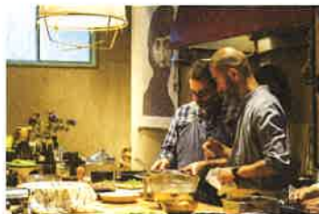
the Blind Donkey